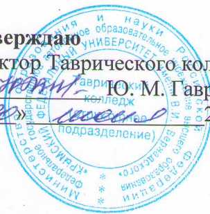
График учебного процесса на 2017-2018 учебный год специальности 42.02.02 Издательское дело