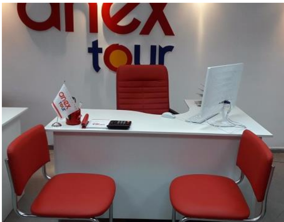
Рис. 1. Рабочее место участника (примерный вариант)

В данном разделе также приведены основные фото, эскизы необходимые для визуализации компонентов застройки конкурсной площадки.