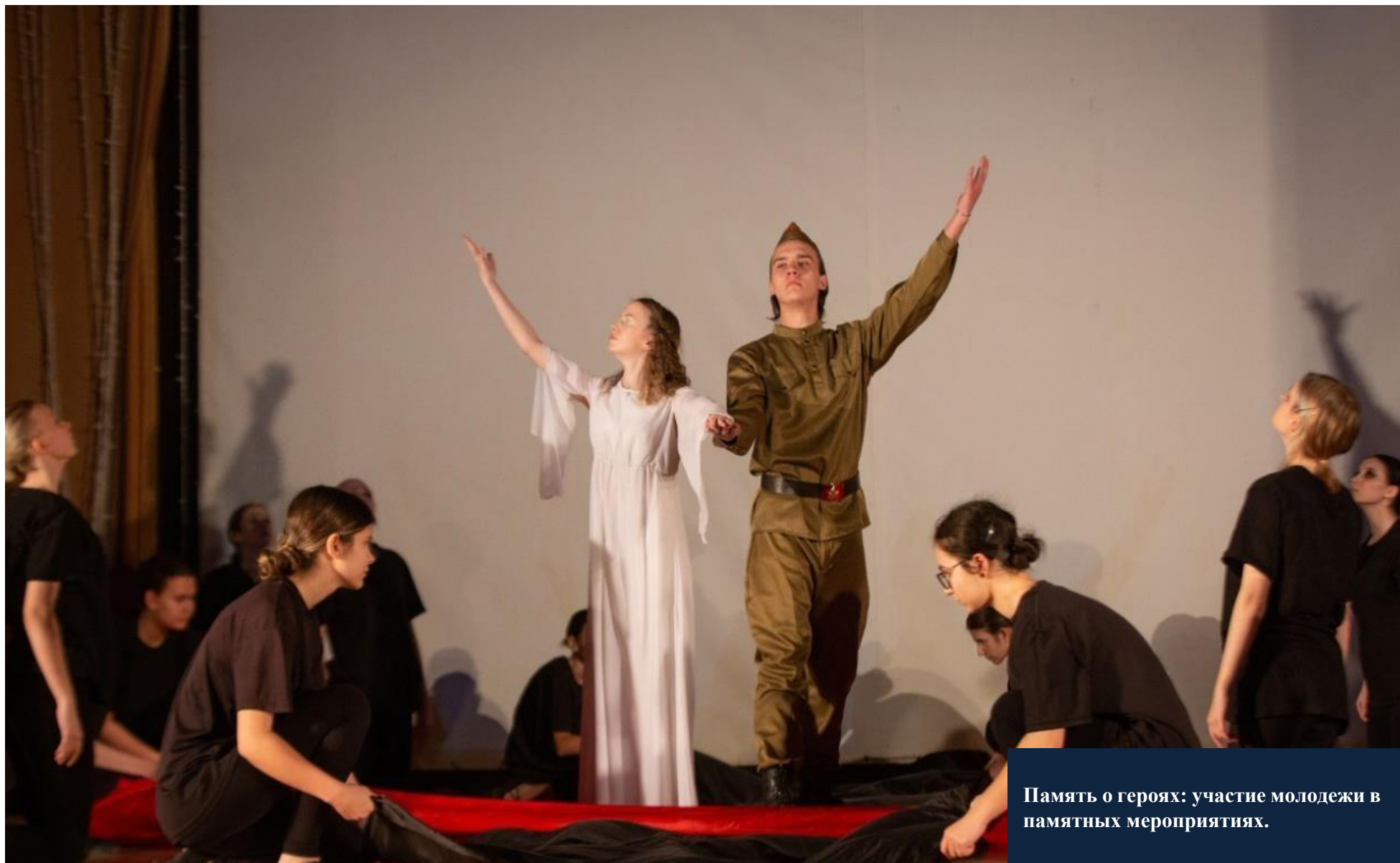
Память о героях: участие молодежи в памятных мероприятиях.

Поддержка армии и ветеранов — это не только долг перед историей, но и залог стабильности и процветания нашего общества. Молодежные организации становятся связующим звеном между поколениями, формируя культуру уважения к тем, кто стоял на защите Родины.