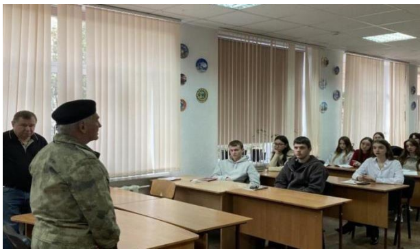
Патриотическое воспитание молодежи: встреча с участником СВО.

Одной из ключевых задач молодежных организаций является патриотическое воспитание. Для нашей страны очень важно освещать военную тему для того, чтобы дети чтит память о Великой Отечественной, а также заботились о создании светлого мирного будущего. Организации, такие как «Юнармия», «Российское движение школьников» и другие, активно проводят мероприятия, направленные на формирование патриотического сознания. Эти мероприятия включают в себя военно-патриотические игры, экскурсии по местам боевой славы, встречи с ветеранами и военнослужащими. Такие инициативы помогают молодежи лучше понять значение службы в армии, осознать важность защиты Родины и развить чувство гордости за свою страну.