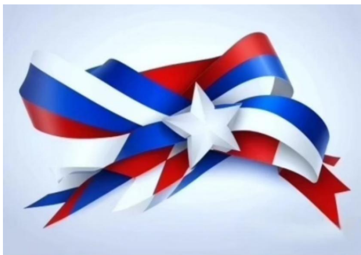
23 февраля. Символ мужества и отваги.

День Защитника Отечества — один из значимых праздников в России, отмечаемый 23 февраля. Его история уходит корнями в начало XX века и связана с событиями, происходившими во время Первой мировой войны. Праздник изначально возник как День Красной Армии, который был установлен в 1922 году в честь формирования Рабоче-крестьянской Красной Армии в 1918 году. Этот день стал символом мужества и героизма, проявленных советскими солдатами в борьбе за защиту своей страны.