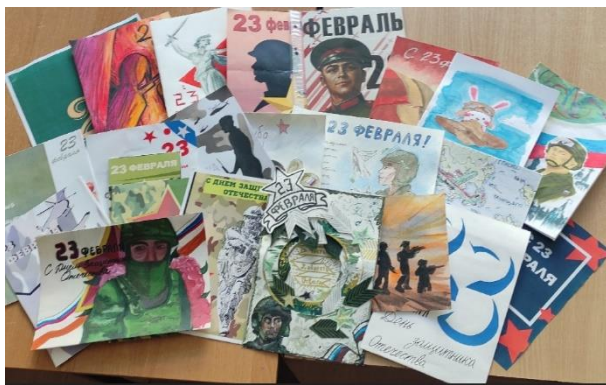
Патриотическое воспитание начинается с детства. Ребята готовят подарки для защитников Родины.