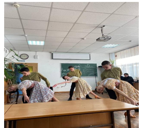
Мероприятия – важная часть патриотического воспитания. Ученики выражают свою благодарность защитникам Родины.

от возраста или социального статуса. Он напоминает нам о важности защиты нашей страны и о необходимости сохранять память о тех, кто отдал свою жизнь за наше будущее. История России полна героических страниц, и именно они формируют наше настоящее. Без понимания прошлого сложно осознать ценность свободы и независимости, которые мы имеем сегодня. Этот день продолжает оставаться важным элементом российской культуры, формируя новые традиции и ценности для будущих поколений. В этот день мы не только чествуем ветеранов и действующих военнослужащих, но и задумываемся о том, как каждый из нас может внести свой вклад в защиту Родины. Патриотизм проявляется не только в военных подвигах, но и в повседневной жизни, в заботе о своем городе, стране и её будущем. День защитника Отечества — это не только дань уважения прошлому, но и призыв к действию в настоящем ради светлого будущего.