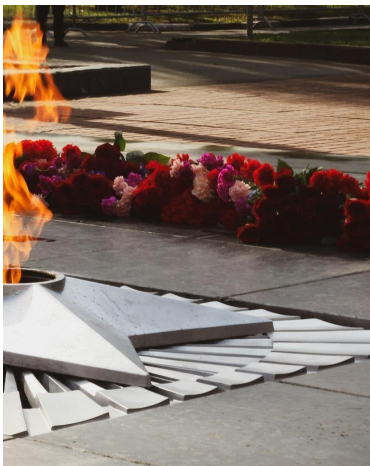
День Защитника Отечества: память о героях, дань уважения защитникам Родины.

День Защитника Отечества также стал временем для семейных встреч и поздравлений. Женщины поздравляют своих мужей, отцов, сыновей и братьев, выражая им благодарность за защиту и поддержку. Праздник приобрел элементы народной культуры: многие семьи устраивают праздничные обеды, дарят подарки и организуют совместные досуги. В последние годы внимание к этому празднику возросло, и он стал символом единства и сплоченности нации. В условиях современных вызовов и угроз национальной безопасности значимость Дня Защитника Отечества только возрастает. Он напоминает о важности защиты своей страны, о мужестве тех, кто стоит на страже мирного неба над головой.