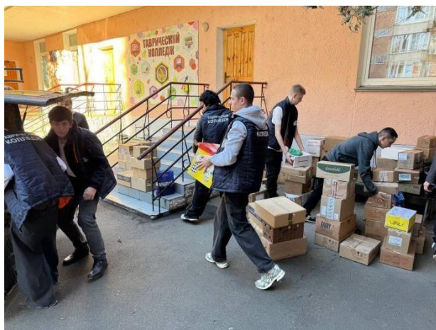
Поддержка армии: сбор и отправка гуманитарной помощи военнослужащим

Молодежные организации активно участвуют в различных акциях, направленных на поддержку действующих военнослужащих. Это может быть, как сбор средств для нужд армии, так и организация волонтерских движений, которые помогают солдатам на передовой. Например, молодежь в своих учебных заведениях собирает гуманитарные грузы, отправляет письма поддержки и подарки бойцам, что создает атмосферу единства и солидарности.