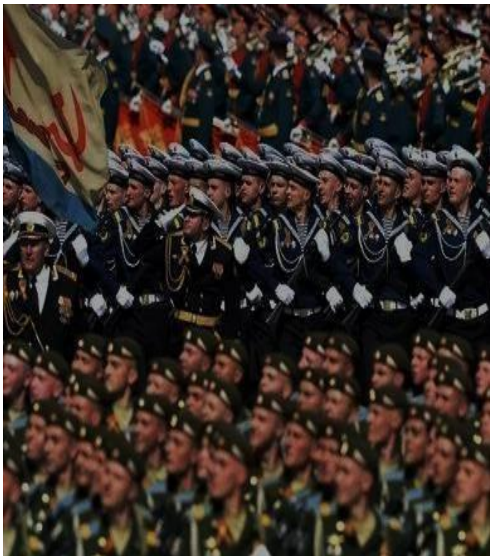
Военные парады в разных регионах страны — символ силы и единства.

На Урале День защитника Отечества также отмечается с особым вниманием к военной истории региона. Здесь проводятся экскурсии по памятникам и мемориалам, посвященным героям войны. В некоторых городах устраиваются выставки военной техники и оружия. Местные жители часто собираются на торжественные мероприятия в школах и вузах, где звучат патриотические песни и стихи о героях. В Западной Сибири праздник отмечается с акцентом на семейные ценности. Многие жители собираются за праздничным столом, чтобы отметить этот день в кругу близких. В некоторых городах проводятся мастер-классы по изготовлению подарков для мужчин, которые затем дарят своим родственникам. Также популярны спортивные мероприятия — от хоккея до армрестлинга.