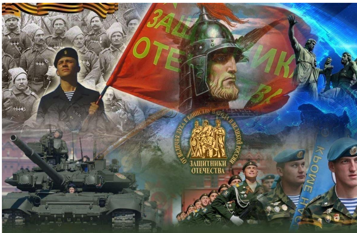
День Защитника Отечества. Сила и мужество защитников России.

День Защитника Отечества — один из значимых праздников в России, отмечаемый 23 февраля. Его история уходит корнями в начало XX века и связана с событиями, происходившими во время Первой мировой войны. Праздник изначально возник как День Красной Армии, который был установлен в 1922 году в честь формирования Рабоче-крестьянской Красной Армии в 1918 году. Этот день стал символом мужества и героизма, проявленных советскими солдатами в борьбе за защиту своей страны.