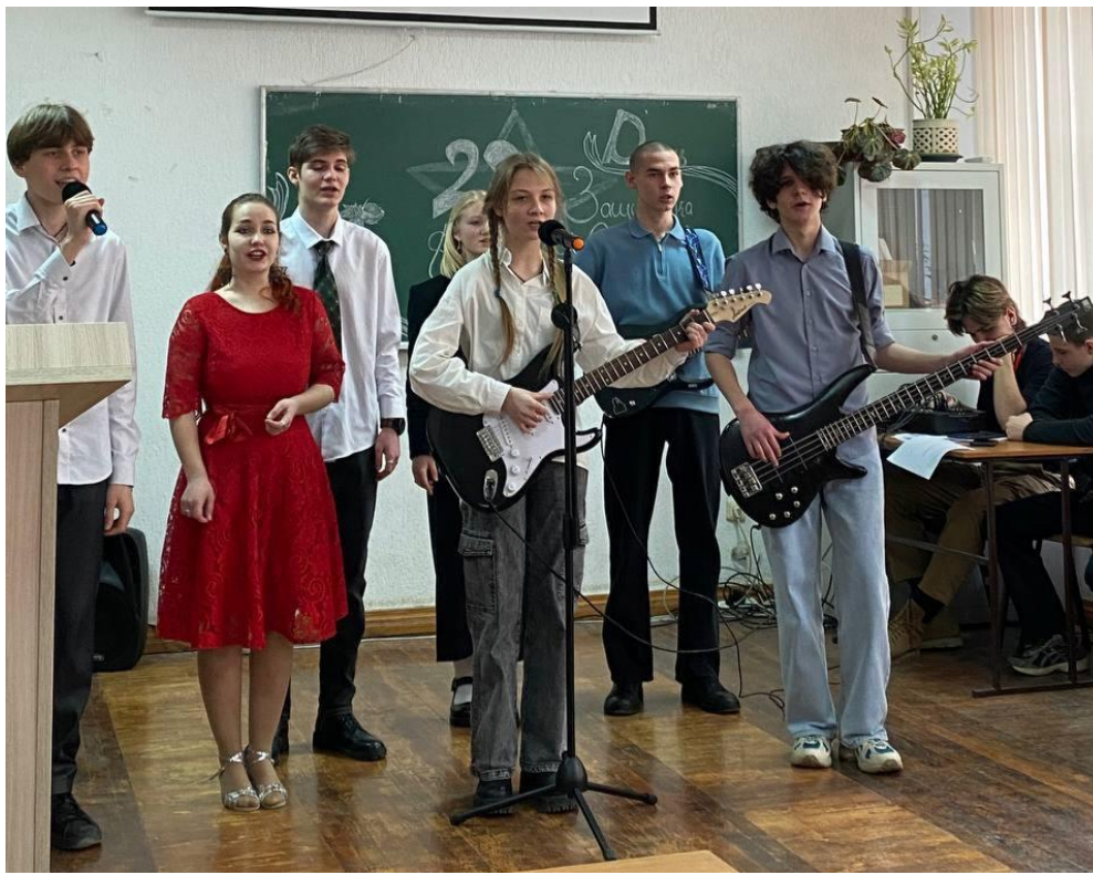
Передача опыта и памяти помогают молодым поколениям понимать значение Дня Защитника Отечества.

Новое время – новое значение: После распада СССР праздник сохраняется, но его значение вновь трансформируется. В 2002 году он получает официальное название "День защитника Отечества", подчеркивая связь с патриотизмом и защитой Родины. Сегодня этот праздник объединяет поколения, являясь символом мужества, стойкости и преданности Родине. Он служит напоминанием о важности защиты своих близких и своей страны. В этот день мы отдаем дань уважения не только военнослужащим, но и всем, кто своим трудом и самоотверженностью к процветанию и безопасности России.