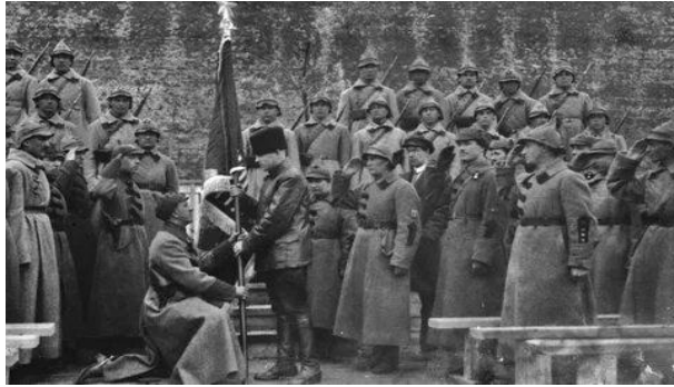
23 февраля 1918 года: рождение Красной Армии – начало истории Дня Защитника Отечества.

2. Первая победа Красной Армии (1918 год) в тот же день произошла первая успешная операция Красной Армии против германских войск, что стало символом начала борьбы за независимость и защиту новой власти. Эта победа укрепила дух и легитимность Красной Армии.