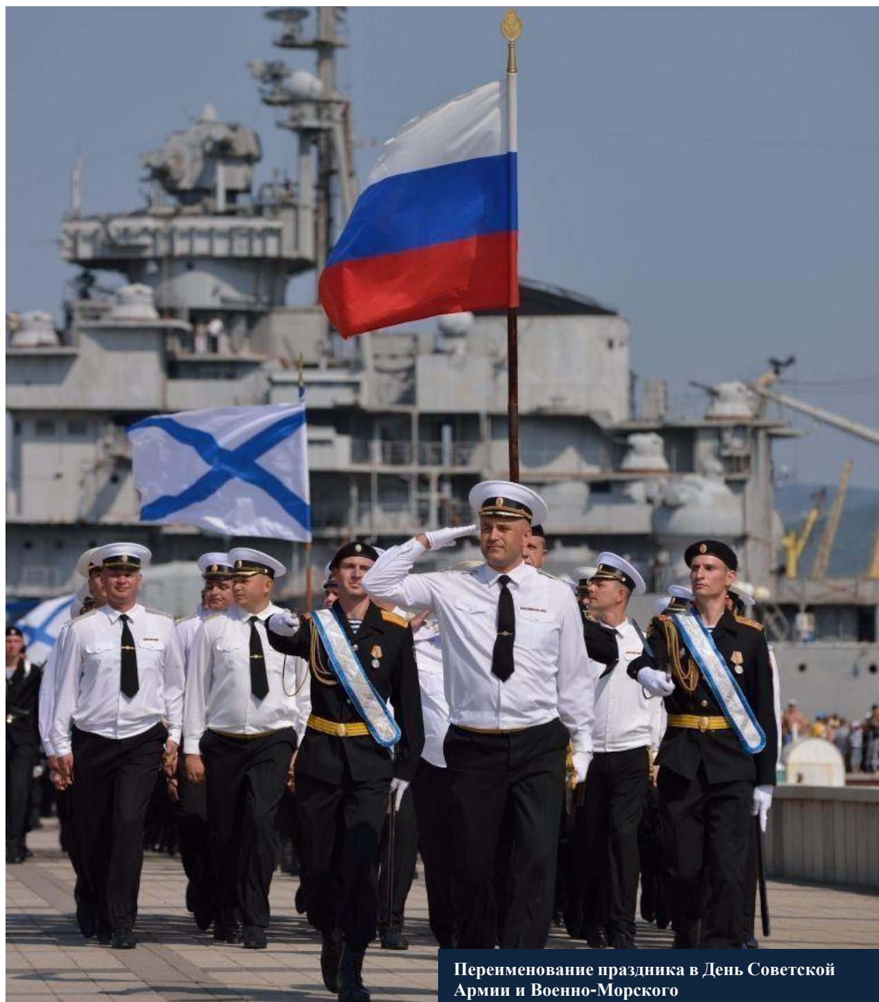
Переименование праздника в День Советской Армии и Военно-Морского Флота. Отражение роли вооруженных сил в послевоенной жизни страны.