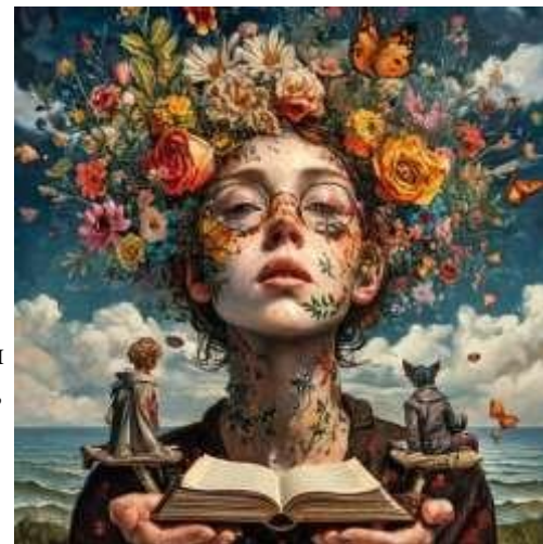
Человек и литература

Литература — это мощный инструмент формирования личности. Она не только развлекает, но и обогащает наш внутренний мир, помогает стать более чуткими и понимающими людьми. Важно помнить, что каждая прочитанная книга оставляет свой след в нашем сознании, формируя нас как личностей.