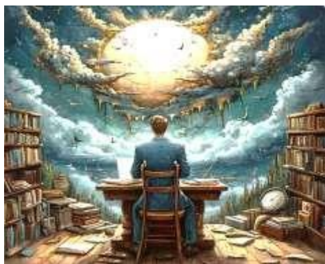
Творческий кризис писателя

Творческий кризис — термин, который часто встречается в разговоре о художниках, писателях, музыкантах и других творческих личностях. Он описывает состояние, когда человек сталкивается с трудностями в процессе создания, теряет вдохновение или не может реализовать свои идеи. Но действительно ли это явление существует, или же оно является мифом, созданным обществом вокруг творческих профессий?