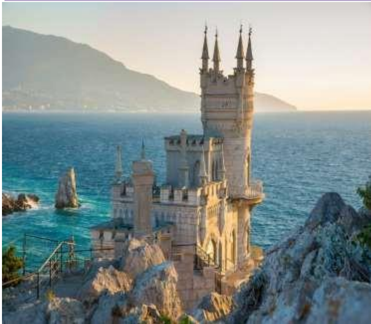
Фотография Ласточкиного гнезда, Крым