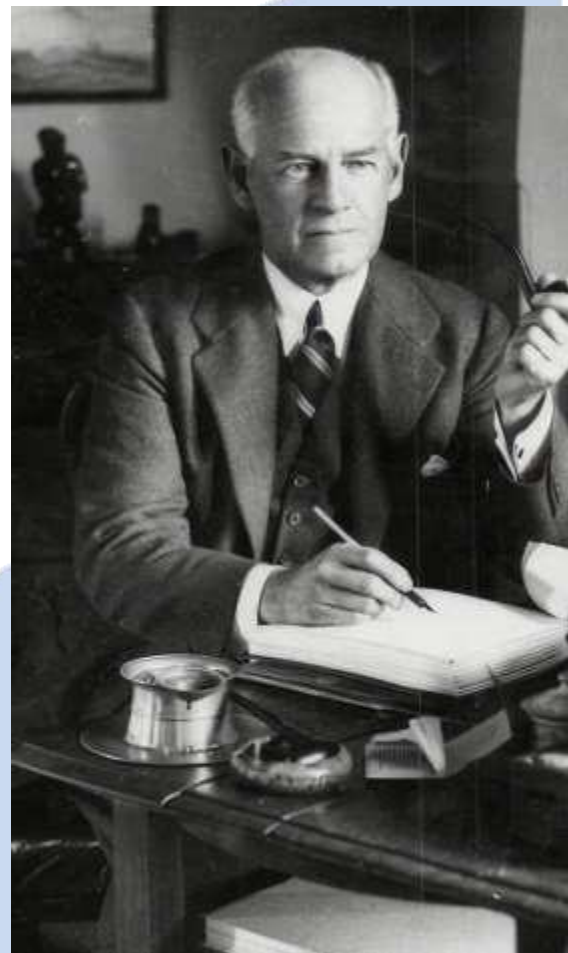
Джон Голсуорси за работой

В день праздника по всему миру организуют различные мероприятия, включая симпозиумы, семинары, конференции, чтения произведений. Это могут быть мероприятия в библиотеках, книжных магазинах, культурных центрах или онлайн-встречи.