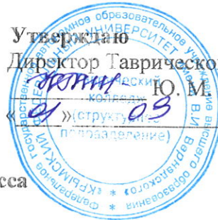
График учебного процесса Заочного отделения на 2025-2026 учебный год специальности 43.02.16 Туризм и гостеприимство