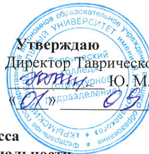
График учебного процесса на 2025-2026 учебный год специальности 09.02.01 Компьютерные системы и комплексы