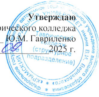
График учебного процесса на 2024-2025 учебный год специальности 43.02.10 Туризм