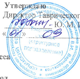
График учебного процесса Заочного отделения на 2025-2026 учебный год специальности 38.02.03 Операционная деятельность в логистике