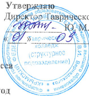
График учебного процесса Заочного отделения на 2025-2026 учебный год специальности 38.02.06 Финансы